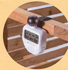
ポールに取り付け