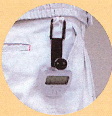
ベルトに取り付け