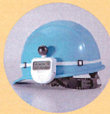
ヘルメットに装着